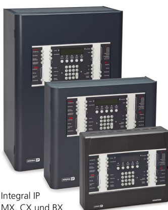
Integral IP MX, CX und BX